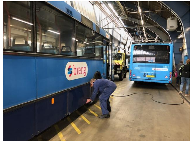
Inspectie van de zekeringen van trolley 5180