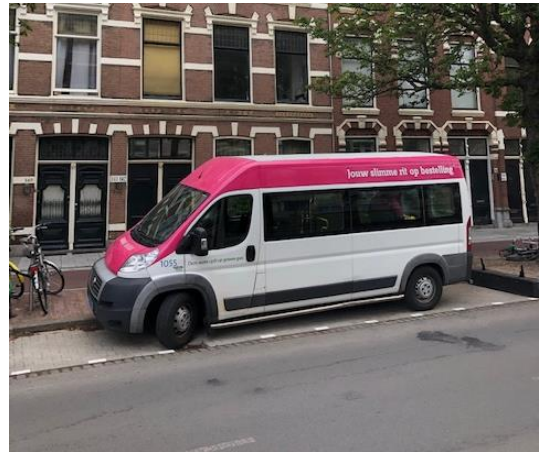
Een voormalig Hermes Fiat Ducato-busje, toevallig eigendom van de buurman van de STA-voorzitter.