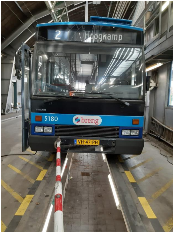
Aankomst van trolley 5180 boven de werkput in de remise Westervoortsedijk.