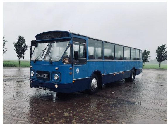
Bus 70 zonder nummer en logo's naast de stalling in Grijskerk. 4 juli 2020.