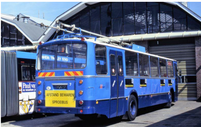
Ontijzelingsbus 7 met Oostnet-logo's op 7 bij de garage. 12 augustus 1997.

Na de rit volgde overleg over bestemming, danwel beschikbaarheid van de bus voor activiteiten in Arnhem. De heer Klein stelde er nog niet aan toe te zijn om in de verkoop te doen, maar verklaarde zich wel bereid om zijn voertuig op ons verzoek bij speciale evenementen naar Arnhem te laten komen. Ook werd ingestemd om de 70 in de STA-website bij de rubriek "overig materieel" op te nemen. Van STA-zijde is aangeboden om tijdens de eerste overkomst naar Arnhem de 70 weer te voorzien van ontbrekende stickers aan de buitenzijde. Daartegen had de heer Klein geen bezwaar.