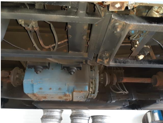
De oude elektromotor van trolley 5180 30 juli 2020

Deze klussen zijn intussen geklaard. Tevens is de trolley APK-gekeurd. Dat is niet hetzelfde als elektro-technisch gekeurd en tot het bovenleidingnet toegelaten worden. Dat is de taak van de Transdev werkplaats. Maar dan moeten eerst de nodige elektro-onderdelen vervangen zijn.