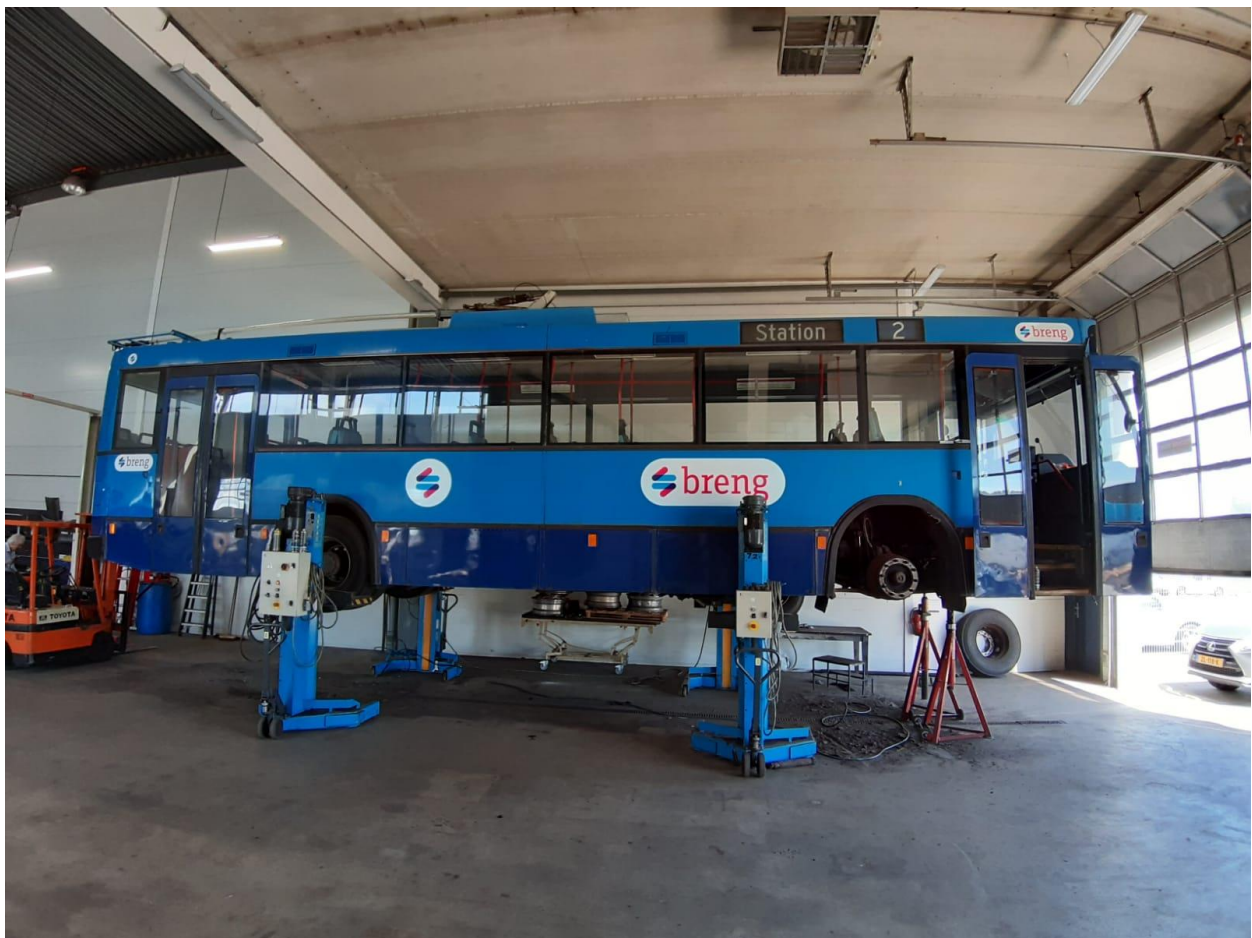
Trolley 5180 op de hefkolommen bij Technopoint voor behandeling van de onderzijde en de assen. Foto Dennis de Lang, 30 juli 2020.

Het is al weer vijf maanden geleden dat de laatste nieuwsbrief van de STA werd gepubliceerd. Het kan duiden op “geen bericht – goed bericht”. Dat klopt voor een deel: het bestuur en de vrijwilligers hebben al die maanden niet stil gezeten. Maar wat we hoopten (en eerlijk gezegd ook verwachtten) ging niet door: met trolley 5180 volledig hersteld de weg op en publiek vervoeren. Het mocht niet zo zijn, het valt niet te verwachten dat het dit jaar nog lukt. Inmiddels zitten we in de tweede coronagolf. Maar niet getreurd: er valt wel wat mee te delen. We doen ons best voor het onmogelijke; wonderen duren wat langer.