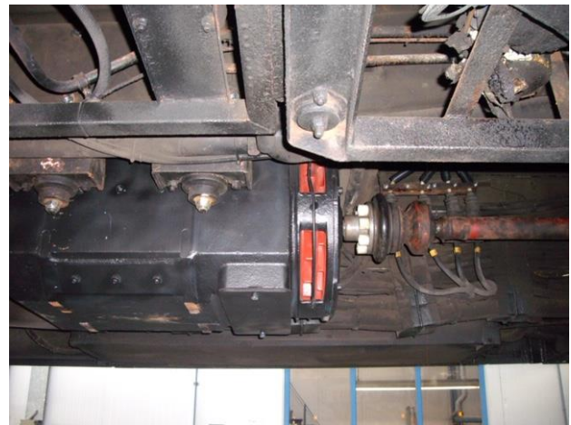
De gereviseerde elektromotor. 7 september 2020

Begin september riep de Transdev werkplaats-manager de 5180 naar de remise Westervoortsedijk. In korte tijd waren de motoren uitgewisseld. Tevens werden delen van de aandrijf-as opnieuw geplaatst. De positie op de hefinstallatie werd tevens gebruikt om ook andere onderdelen te controleren: de schakelkast, de isolatoren en de bekabeling. Bij enkele elektrometingen bleek de weerstand te hoog. Dat wijst op gebreken als corrosie, versleten of kapotte onderdelen en vervuilde contactstroken. De inventarisatie maakte duidelijk dat het een en ander te vervangen en vernieuwen valt. Hiervoor moet hulp van elders worden ingeroepen. Interessant zou men de constatering mogen noemen dat in dertig jaar zich een radicale technische ontwikkeling heeft voltrokken. Alleen heeft deze er ook voor gezorgd dat bekendheid met het oude problematisch is geworden. Het huidige werkplaatspersoneel houdt zich met schakeltechnieken en isolatoren anno 1990 en ouder niet bezig.